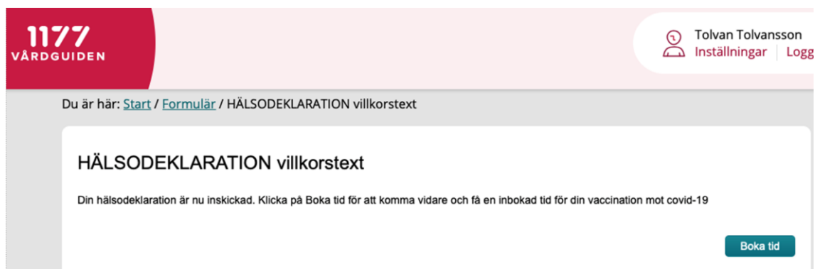
Bild 6: Ny knapp, Boka tid, utvecklad till formuläret, som visas efter att invånaren gått igenom triageringsfrågor och svarat på hälsodeklarationen. När invånaren klickar på knappen Boka tid leder den till regionens valda tidbok. Obs att skärmdumpens rubrik och text ska justeras i den färdiga versionen.

Bild 5: De frågor som ingår i hälsodeklarationen från FOHM och i det digitala formuläret. En fråga om samtycke till att informationen får delas med andra vårdgivare finns också med. Obs att formatering och presentation av frågorna kommer att se något annorlunda ut i mallen när den är färdig.