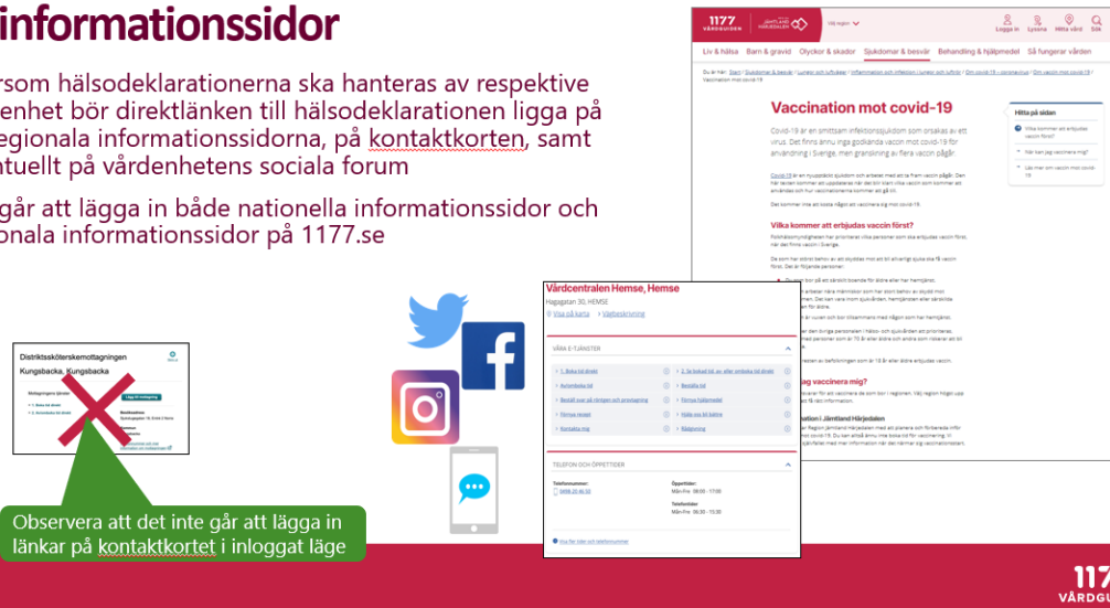
Bild 1: Det finns flera olika sätt att sprida länken till triagering, hälsodeklaration och tidbokning på när man vill göra det öppet, till så många som möjligt.